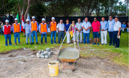
Directivos e ingenieros de obra.